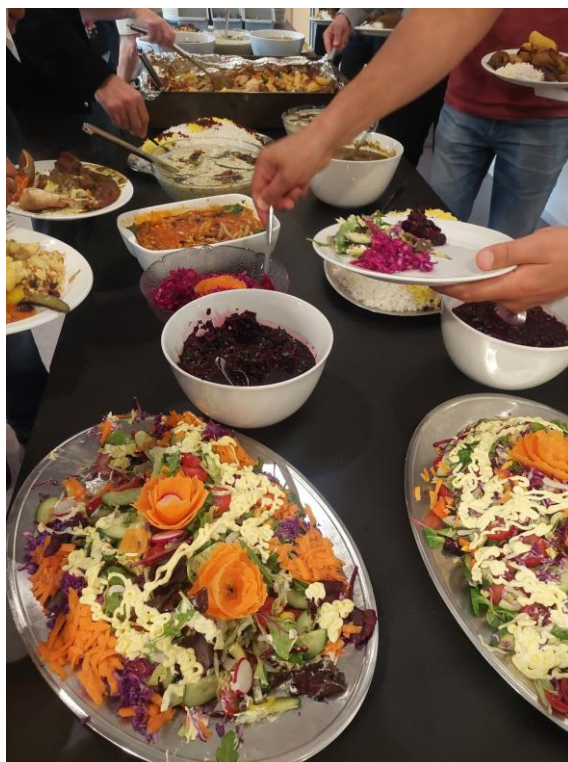
Kurdisk mat