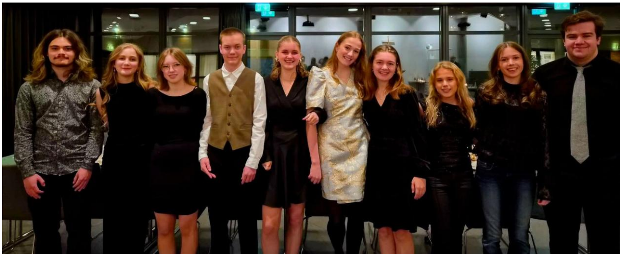
Ungdomskantoriets nyttårsbord