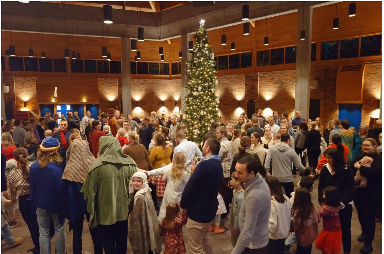
Den store juletefesten 2025