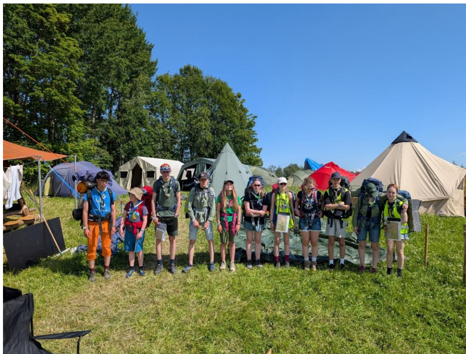
Landsleir på Gjøvik 2025

Spjelkavik speidergruppe har i 2025 fått støtte frå Spjelkavik sokneråd, Frifond, Sparebanken Møre og Grasrotandelen, me takker for støtta.