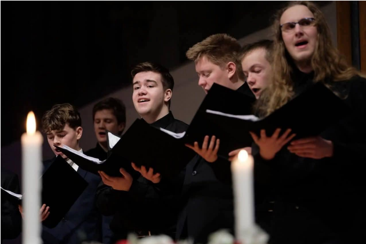
Nyttårsleir i Stavanger