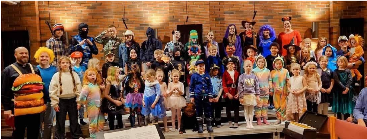
Karneval for Barne- og Ungdomskantoret og Aspirantkoret