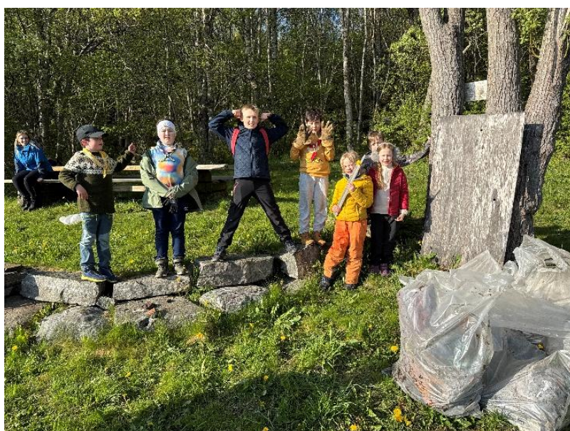
Aktivitet i speidergruppa!